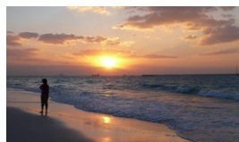
Idylle am Strand