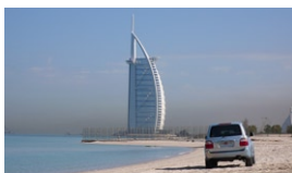
Burj al Arab